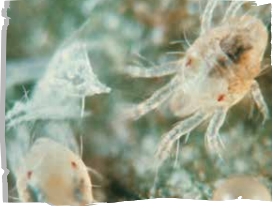
İki Noktalı Kırmızıörümcek ( Tetranychus urticae )