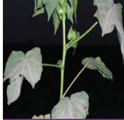
Taraklanma %50 olduğunda