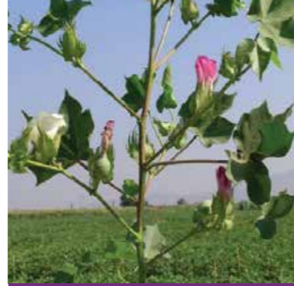
Çiçeklenme doruğu dönemi İkinci ilaçlamadan 15-20 gün sonra (10 m sırada 2-3 fındık gibi koza görüldüğünde)