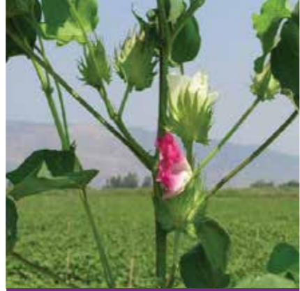
Çiçeklenme başlangıcı dönemi, birinci ilaçlamadan 10-15 gün sonra (10 m sırada 2-3 çiçek görülürdüğünde)