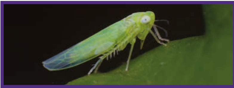
Pamuk yaprakpiresi ergini