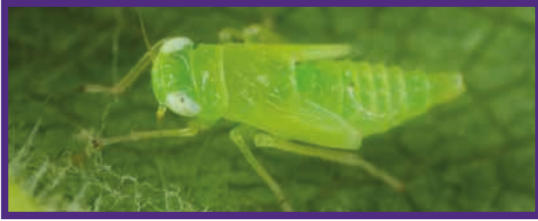
Pamuk yaprakpiresi nimfi

Bitkinin özsuyu ile beslenerek zarara yol açan pamuk yaprakpireleri, yaprakların uçtan itibaren sararıp kızarmasına ve sertleşerek içe doğru kıvrılmasına neden olur. Yoğun popülasyonlarda emgi sonucu yaprak ve tarak dökülmesi ve dolayısıyla verim kaybı yaşanır. Empoasca 'dan zarar görmüş yapraklar defoliant uygulamasından sonra tam olarak dökülemez, bitki üzerinde kuruyarak asılı kalan yapraklar makineli hasatta pamuğun çepeli toplanmasına yol açar.